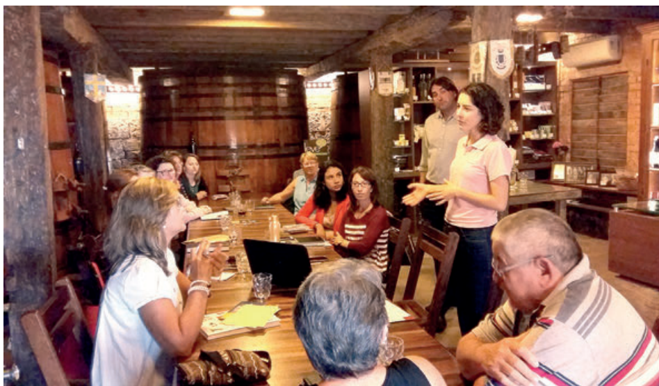
Empresários do projeto retomaram as atividades planejando as ações para 2016

Também fica definido a readequação do site, em parceria com a Agência Tatum Ideia 360°, para atender mais eficazmente a demanda do consumidor. E ações para ampliar a rede de relacionamentos seja entre o grupo,