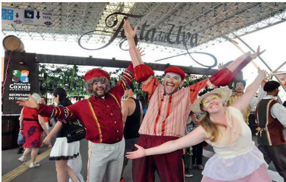
Elenco de companhia teatral recepcionou visitantes junto ao Estande da Hospitalidade e no portão de acesso dos ônibus de turismo

próprios empreendedores. Além do balcão de hospedagem e gastronomia, para atender demandas do visitante seja sobre hotelaria