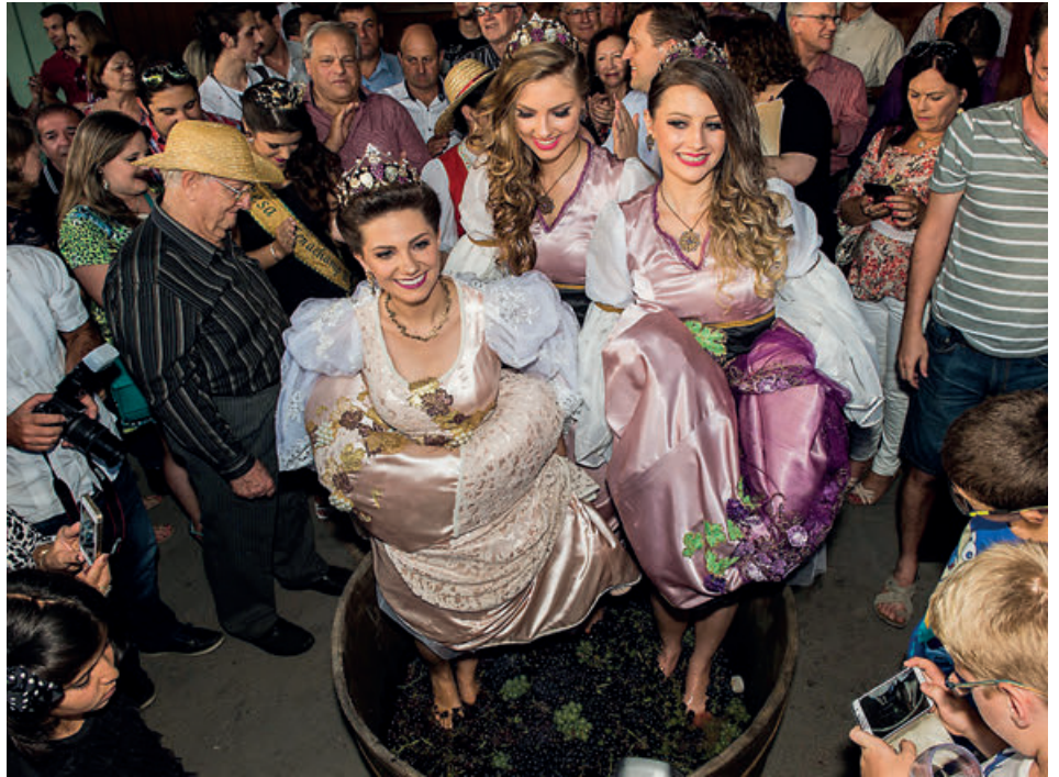
Em Bento Gonçalves, a tradicional pisa das uvas

Bento Gonçalves - A época de celebrar a colheita do fruto que dá origem ao principal produto turístico do município, o vinho, aconteceu de 19 de janeiro a 19 de março. As atrações que integram a programação do Bento em Vindima vão desde a colheita simbólica e a pisa das uvas, apresentações culturais de corais, jogos italianos e gastronomia típica. A programação ocorre também nos hotéis, vinícolas e restaurantes que oferecem pacotes promocionais com atrações paralelas.