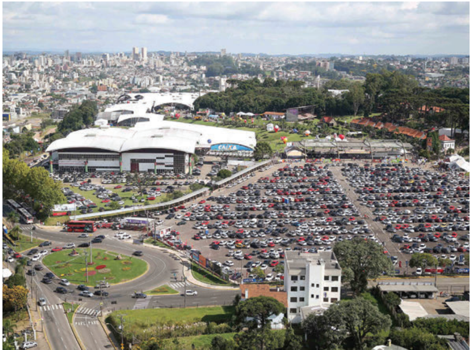
Os números da 31ª edição da Festa da Uva apontaram a passagem de 941.622 visitantes pelo parque e lucro recorde de R$2.209.793,00