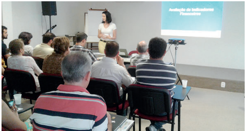
O Polo Gastronômico Serra – Caxias do Sul e Bento Gonçalves retomou as atividades neste trimestre