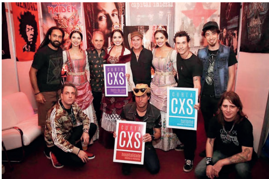
Diversos artistas que passaram pela Festa da Uva foram convidados para curtir a cidade