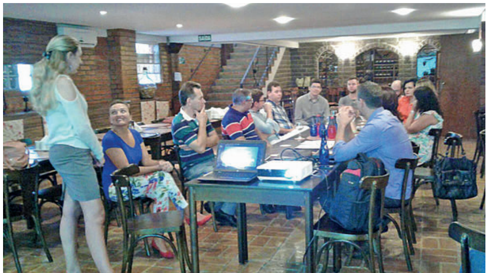
Palestra, realizada em fevereiro, apresentando legislação referente a licenças ambientais