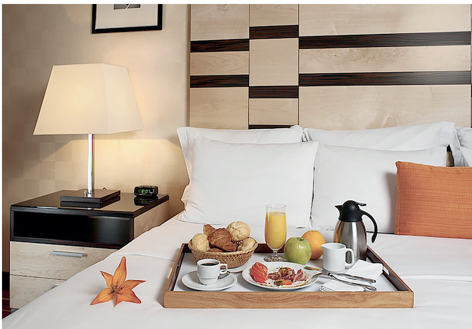
Setor está sendo diretamente atingido com a instabilidade econômica do país

O presidente da FBHA sustenta que a gravidade do período atual é inquestionável. Cita, como argumento, a visibilidade que os reflexos da crise têm ganho nas manchetes dos principais veículos da imprensa internacional. “Os empresários de turismo estão sendo afetados em seus negócios no momento em que o Brasil torna-se um dos destinos preferidos dos turistas internacionais e que, por conta do ingresso de divisas e do