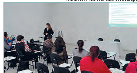
» Inovação em Turismo, Feevale/Veranópolis