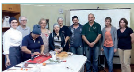
» Oficina de Corte e Preparo de Carnes/Vila Flores