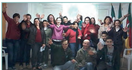
» Animação para Hotelaria e Gastronomia/Nova Prata