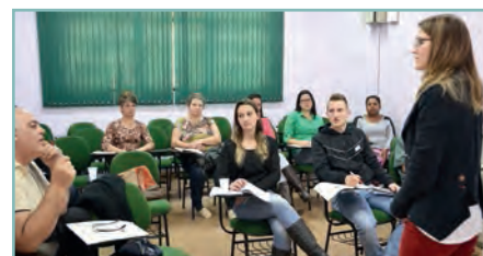
» Como Vender meu Produto/Guaporé