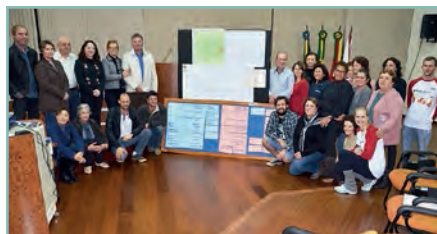
» Gestão em Turismo Rural/Nova Bassano