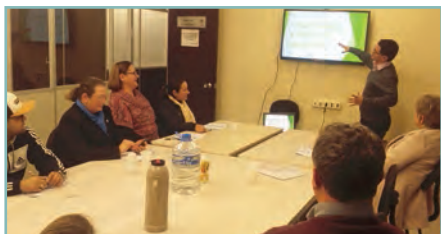
» Desenvolvimento de Líderes/Farroupilha