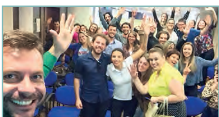
» Marketing On-line e Redes Sociais/Bento Gonçalves